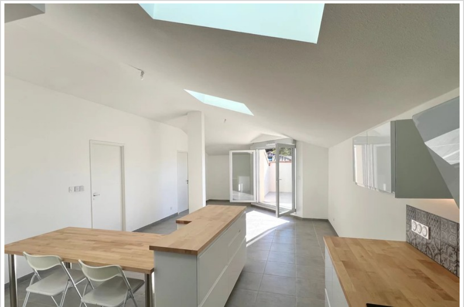
Apartment 579 Cogolin